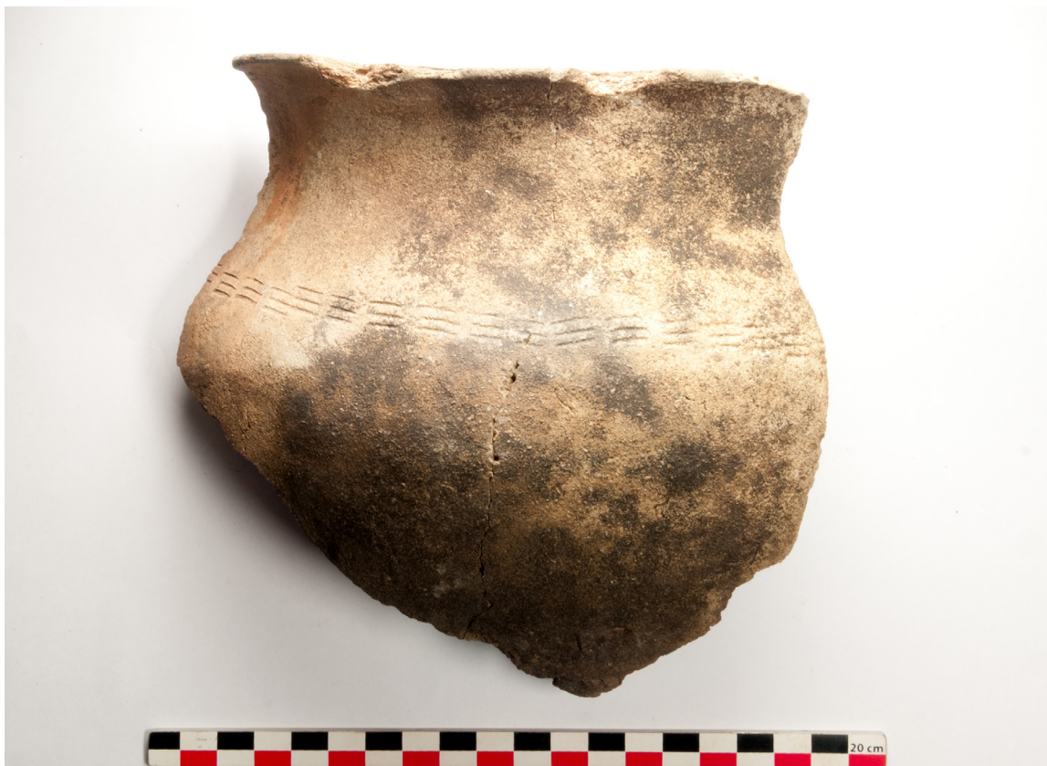
Figure 4: Céramique de surface, Makuti.