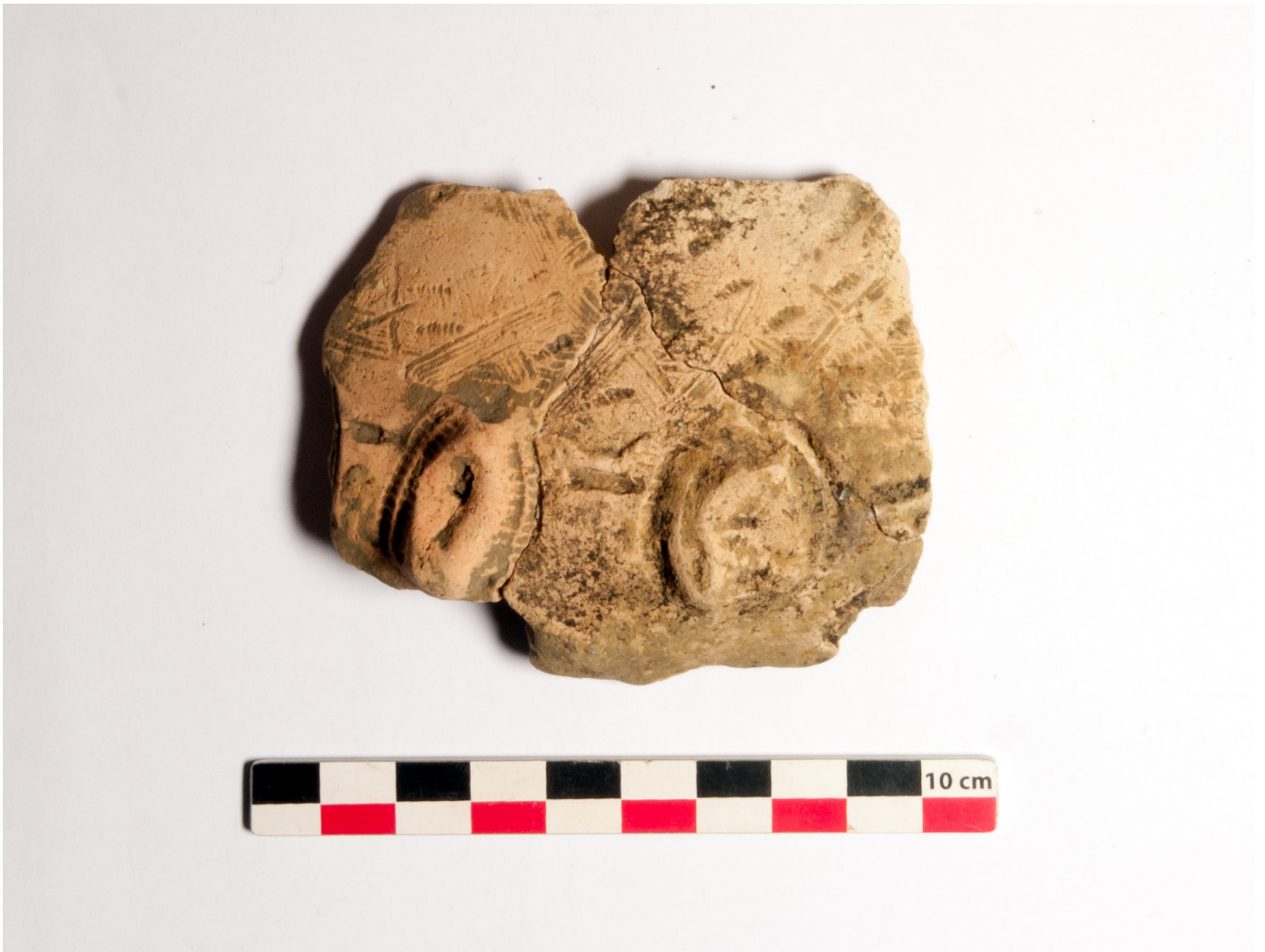
Figure 6: Céramique découverte à Nkabi.

Une butte de terre très foncée, sans doute également liée à du rejet métallurgique a aussi fait l'objet d'une coupe et présentait le même type de céramique.