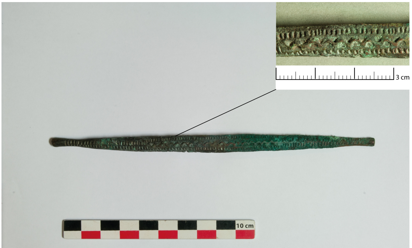
Figure 3: Ngele en cuivre. Makuti, République du Congo.