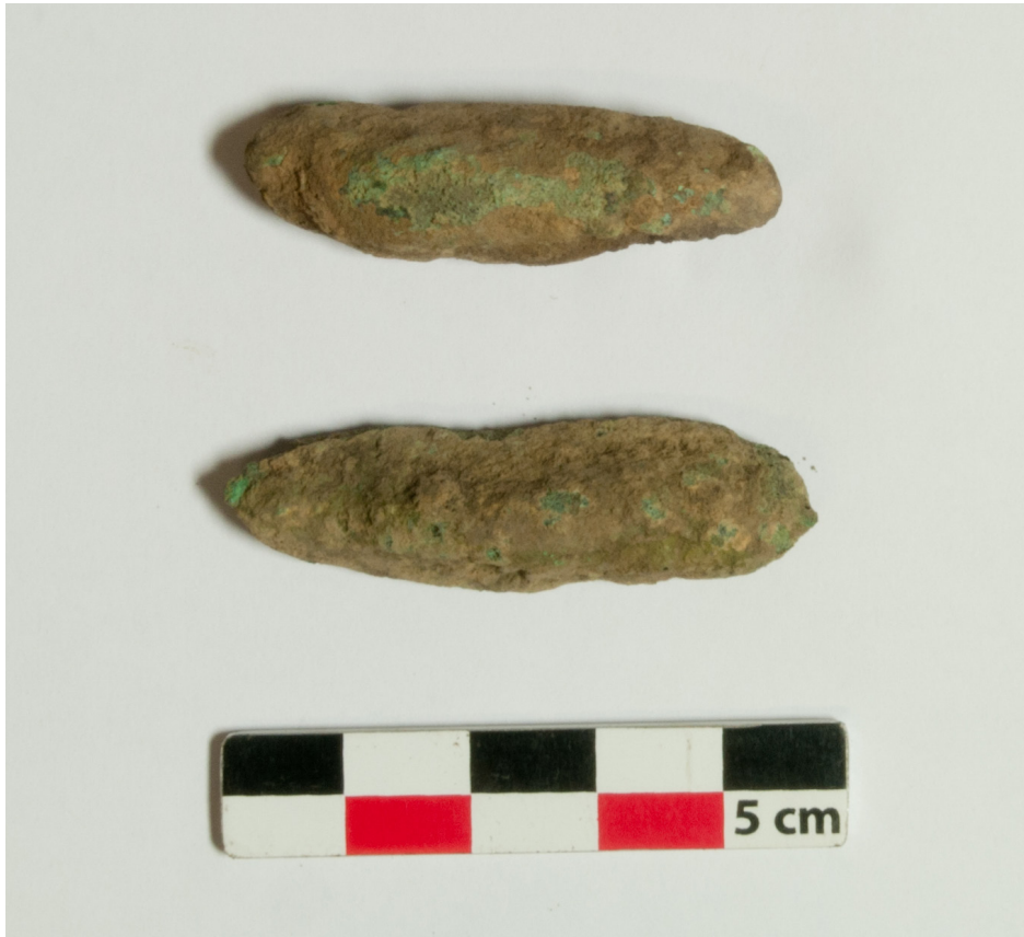
Figure 7: Lingot de cuivre. Nkabi, République du Congo.