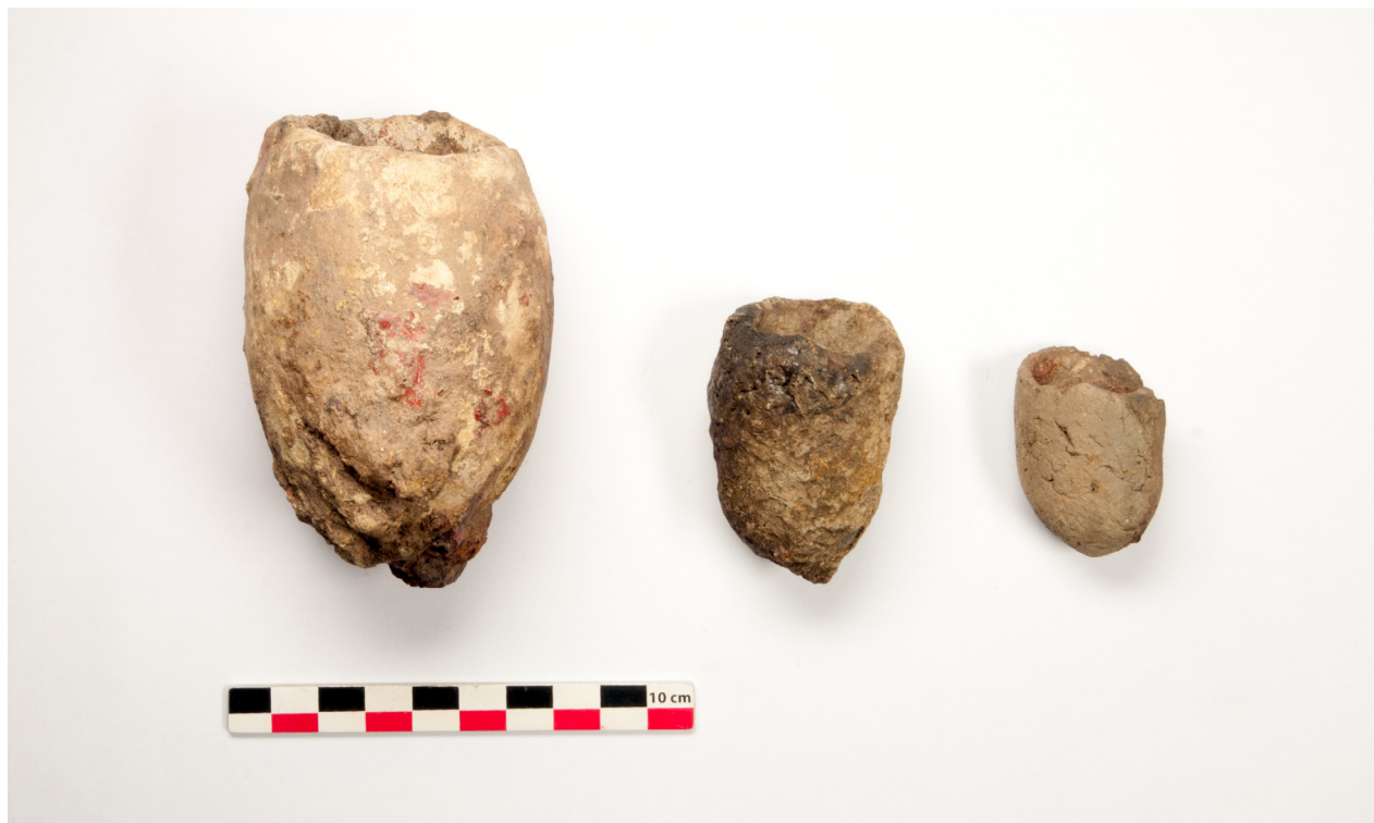
Figure 8: Creusets en terre cuite découverts à Mindoundou.

Les résultats de cette mission sont prometteurs. Les prospections et les sondages confirment la présence importante de vestiges de métallurgie du cuivre dans la région de Mindouli. Leur étude va permettre d’y associer des groupes céramiques de différentes époques dont certains reflètent les circuits commerciaux qui reliaient cette zone de gisement de cuivre à d’autres régions. Un premier examen de ces groupes montre déjà une certaine homogénéité et la suite de leur analyse devrait permettre d’élaborer une première séquence céramique pour cette région de la République du Congo. Il sera alors possible de la relier avec ce qui