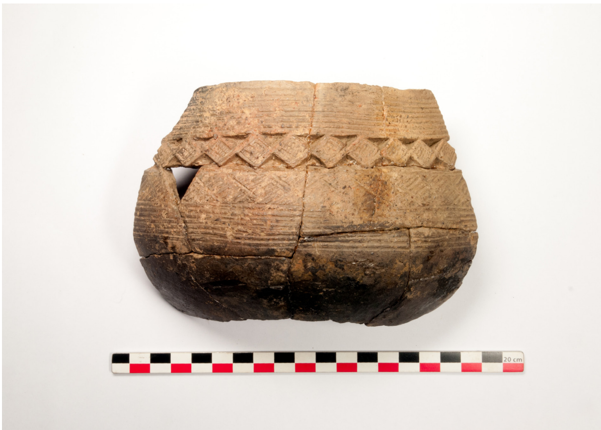
Figure 5: Pot du Groupe II, Makuti.

La céramique de surface peut être regroupée en deux types. Un premier où le décor se limite à une bande au niveau de l'épaule (Figure 4) et un second qui comporte un décor couvrant sur le haut de la panse, fait de multiples traits disposés en triangle et de chevrons (Figure 5). Ce type se retrouve également en stratigraphie et présente de grandes affinités stylistiques avec la céramique du « groupe II » ou « groupe Mbafu » qui a été découverte dans une série d'autres sites à travers le Bas-Congo en RDC (Clist 1982, 1991, 2012; de Maret 1972, 1982), et notamment à une dizaine